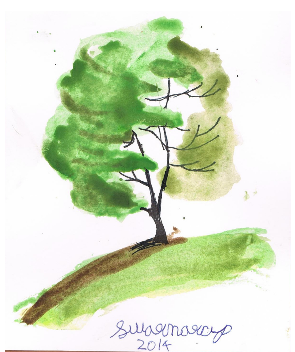
Swarnarup Paria, Age: 9